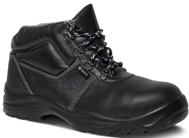
■ 2804 NOIR | 36 ▶ 48